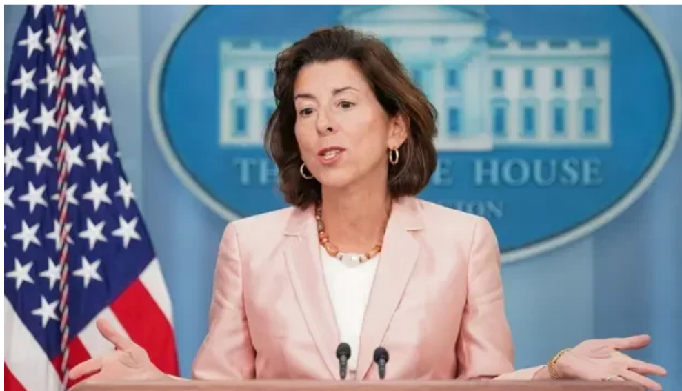
2022年9月，美商务部宣布禁止高科技企业在华设厂