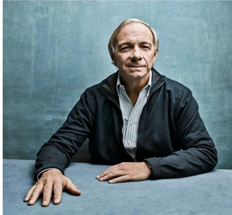
桥水基金创始人-瑞·达利欧