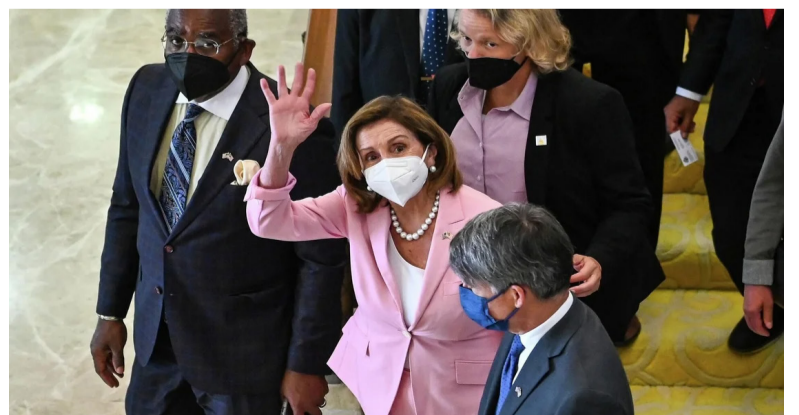
去年8月佩洛西访台，次月美国务院批准10亿美元对台军售