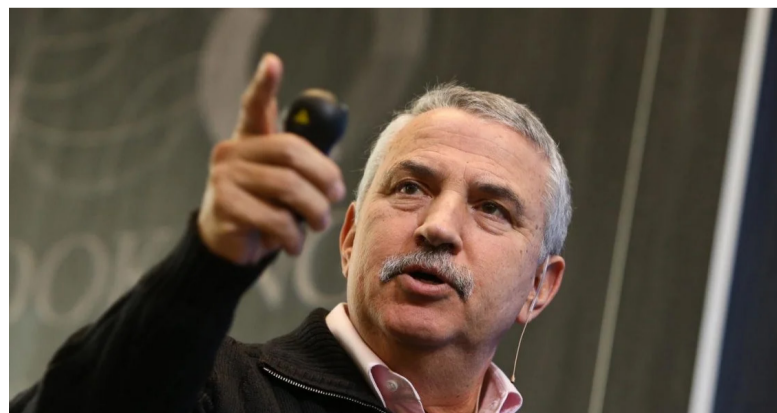
三届普利策奖得主，著名国际问题专家，美国顶级媒体人托马斯·弗里德曼