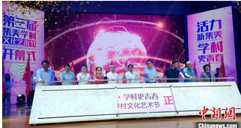
第三届集美学村文化艺术节6日在厦门医学院拉开序幕。