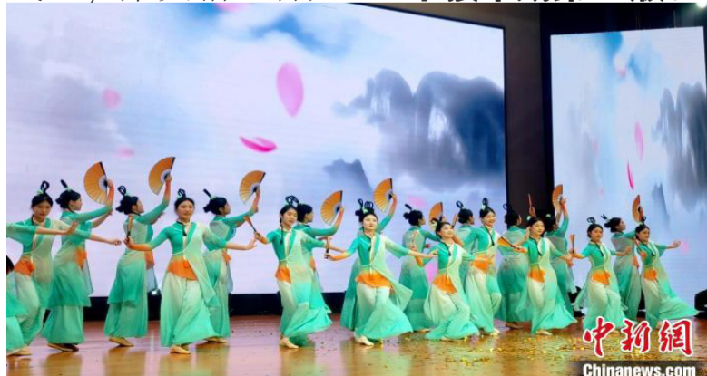
集美学子借助艺术节舞台,展示各自新颖别致的作品。