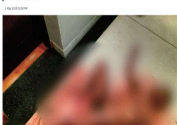
死者为一对20多岁的中国籍男女