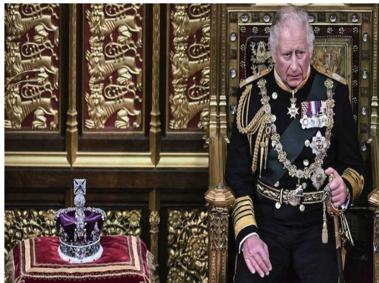
英国查尔斯三世国王