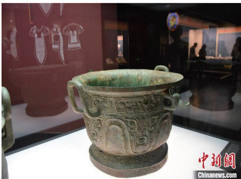
图为特展文物。