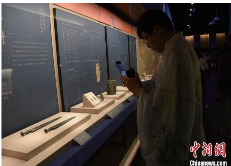
图为游客正在观看特展。

这件镂空三彩龙凤炉是元代的琉璃三彩器，出土于北京朝阳区，现收藏于首都博物馆。作为熏炉，它炉顶为博山炉形制，在嶙峋的山石之间盘绕一龙，炉侧有两耳，炉腹圆鼓镂空，雕刻有凤纹饰。现场讲解员介绍，琉璃是玻璃制品的一