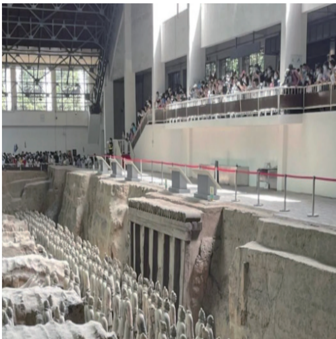
西安兵马俑博物馆