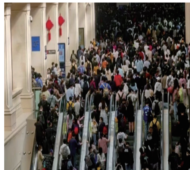
武汉汉口车站扶梯