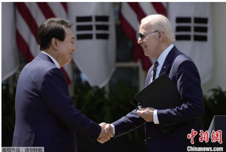
当地时间4月26日，拜登和尹锡悦在新闻发布会上握手。

朱锋指出，美国扩大和韩国的联合军演，美日韩三方加强防卫合作并启动联合军演，如未来在半岛问题上形成“南方三角”，其实在很大程度上也是试图将冷战的阴影重新召回到朝鲜半岛。这只会导致