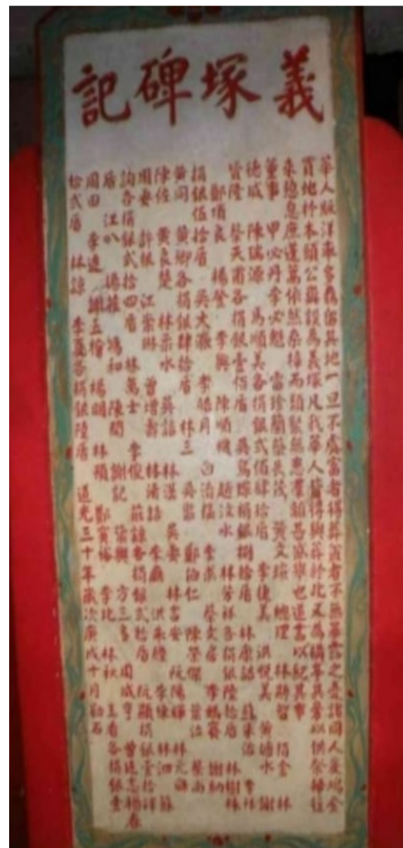
百年前的“西興宫”旧庙。