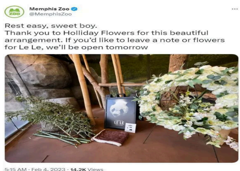
2023年2月4日，孟菲斯动物园发布纪念“乐乐”的推文。