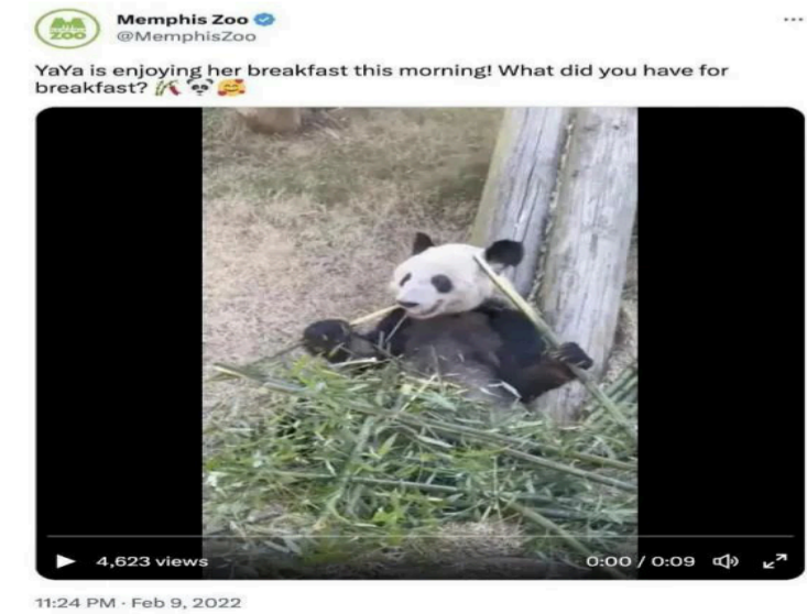
孟菲斯动物园2022年2月9日发布的“丫丫”视频截图。

有网友表示，每天在镜头前关注“丫丫”的情况，感觉“心都碎了”，“我们失去了乐乐，不能再失去丫丫”，希望“丫丫”能尽快回到中国接受治疗，并号召各方共同声援。