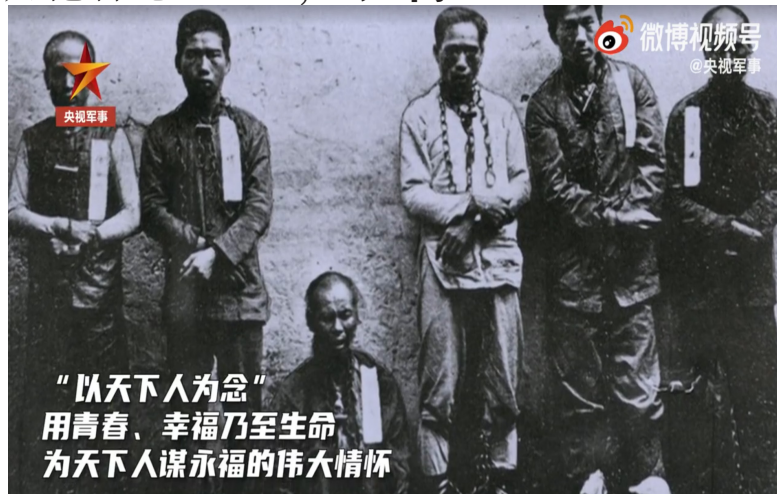
资料图：“三·二九”起义