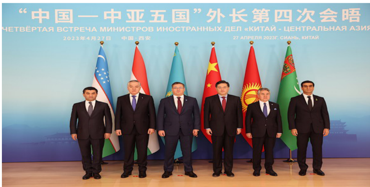
2023年4月27日，国务委员兼外长秦刚在西安主持中国—中亚外长第四次会晤，哈萨克斯坦副总理兼外长努尔特列乌、吉尔吉斯斯坦外长库鲁巴耶夫、塔吉克斯坦外长穆赫里丁、乌兹别克斯坦外长赛义多夫、土库曼斯坦第一副外长哈吉耶夫出席。