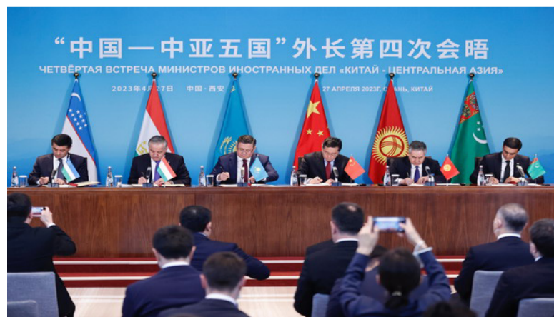
中国—中亚外长第四次会晤现场