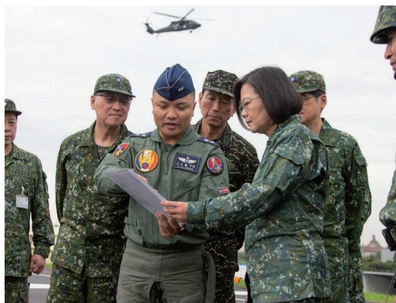
蔡英文视察台湾军队 (台湾国防部)

美国准备向乌克兰提供20亿美元的武器新援助。新的援助计划预计还将包括“标枪”反坦克导弹的支持设备 (路透社)