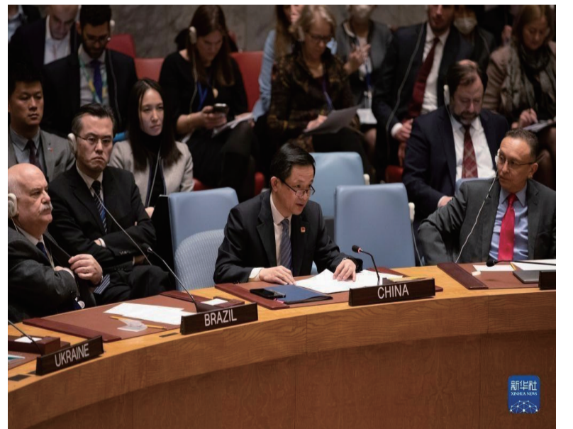
2023年2月24日，在位于纽约的联合国总部，中国常驻联合国代表团临时代办戴兵在安理会乌克兰问题公开会上发言，阐述中方关于政治解决乌克兰危机的立场。