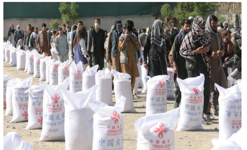
中国为阿富汗人民提供粮食援助

“全球安全倡议是国际公共产品，守护的是全世界人民的幸福安宁。中方愿同各方一道，秉持安全共同体理念，坚持真正的多边主义，协力应对各种传统和非传统安全挑战，共同推进人类和平发展的崇高事业。”汪文斌说。