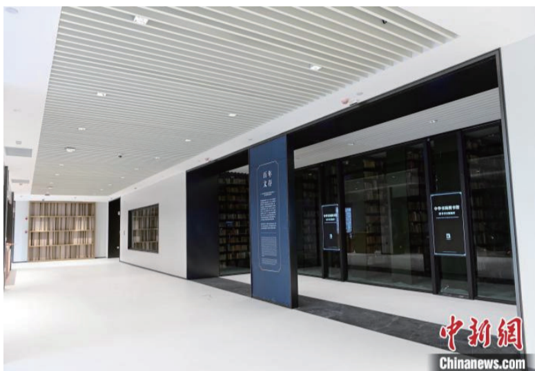
“百年文存”展区。

馆，是中国首座新闻出版专业博物馆。4月22日，该馆启动内测运行，中新网记者前往馆内一探究竟。