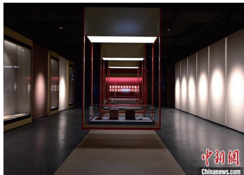
中国近现代新闻出版博物馆。