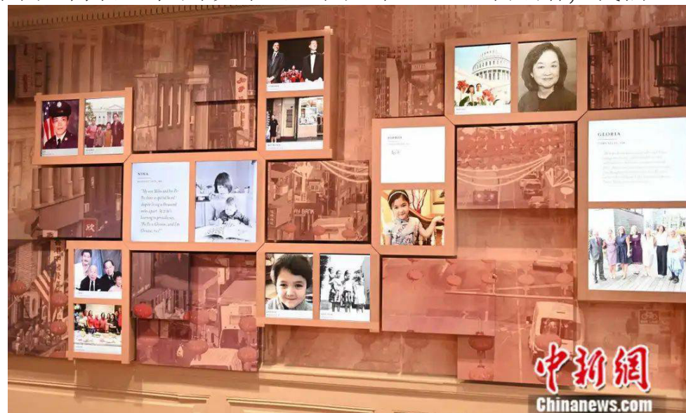
华盛顿美国华人博物馆内的美国华人数字照片墙。