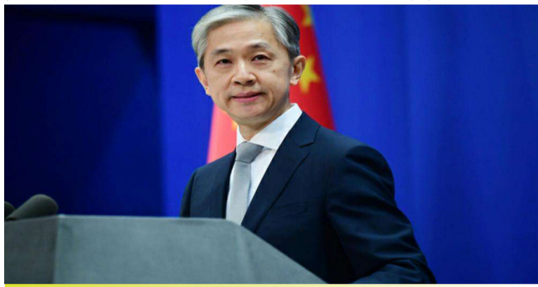
外交部发言人汪文斌