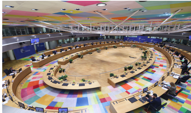
这是3月24日在比利时布鲁塞尔欧盟总部拍摄的欧盟峰会现场。