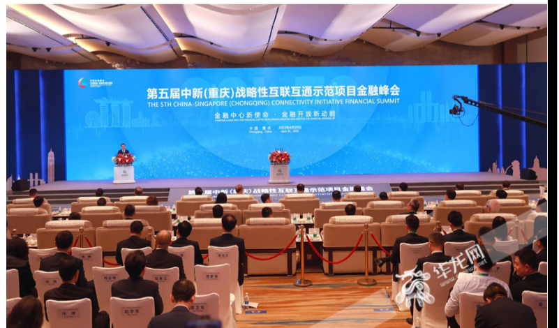
第五届中新(重庆)战略性互联互通示范项目金融峰会在重庆开幕。