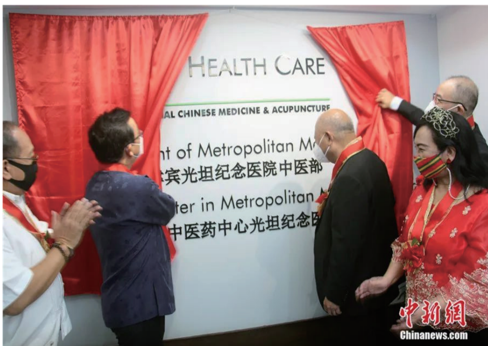
菲律宾光坦纪念医院中医部暨中国—菲律宾中医药中心光坦医院分部揭牌。