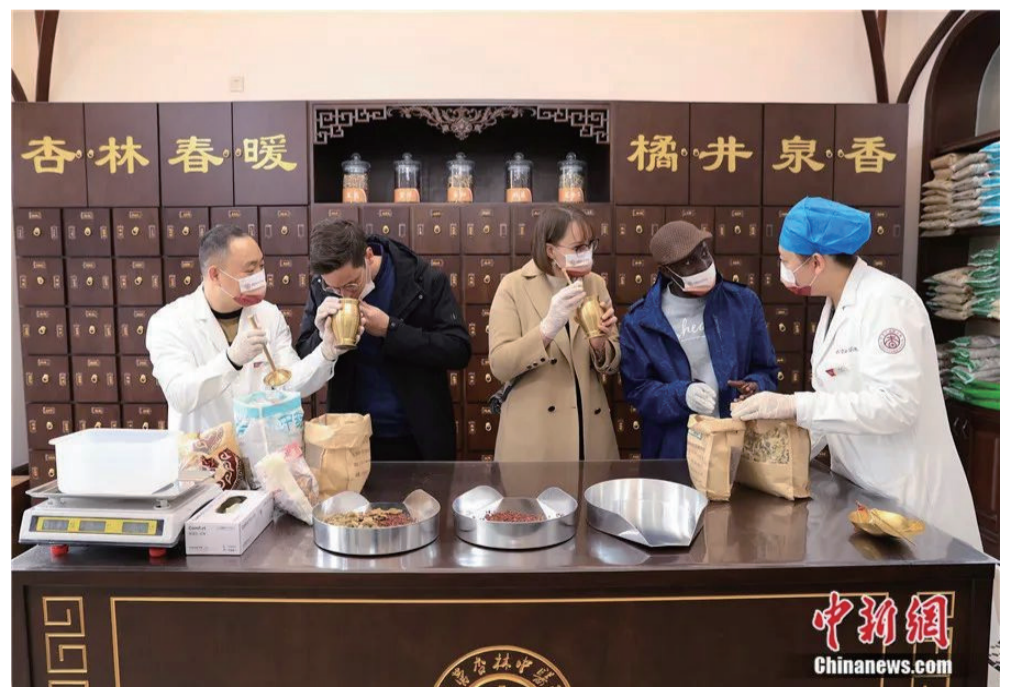
来自比利时、白俄罗斯和加纳的外国友人在山东东营一家中医医院的中药房识别、称量中药材。