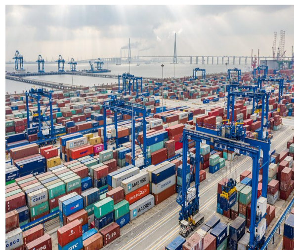
资料图：江苏南通通海港区作业区的繁忙景象