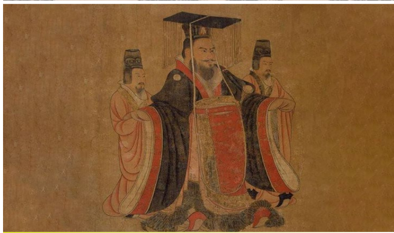
他就是中国历史上的第一位皇帝——秦始皇