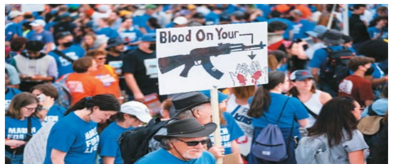
美国各地民众举行集会示威活动倡议加强枪支管控