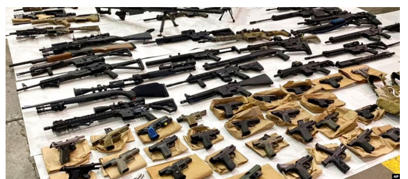
资料照片：美国加州圣何塞警察局2022年6月发布的照片显示了从一名凶杀案嫌犯家中缴获的攻击性武器。