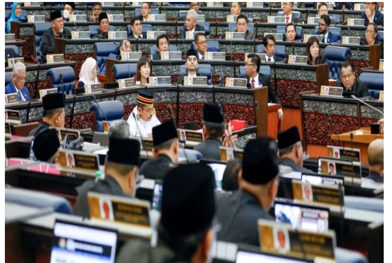
马来西亚议会下议院周一批准了法律改革，以废除对某些罪行的强制性死刑。半岛电视台视频截图。