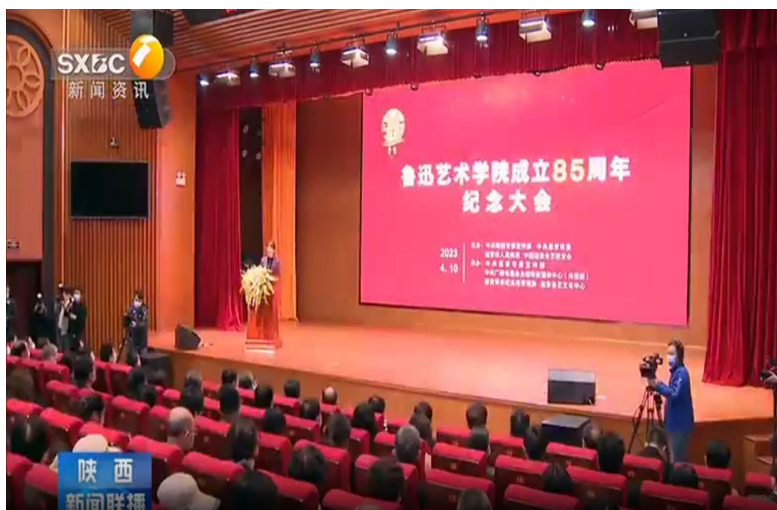
鲁迅艺术学院成立85周年纪念大会现场