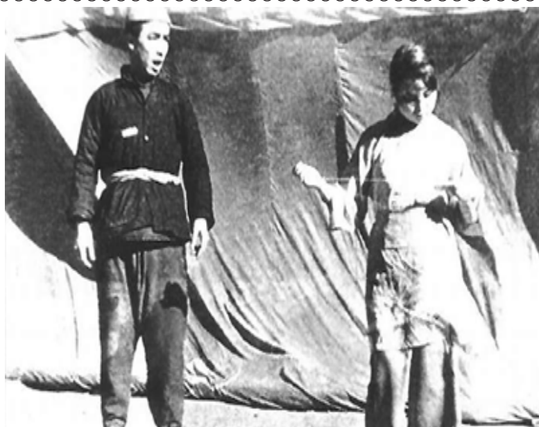
1947年年初，鲁艺一团在东北农村演出秧歌剧《李二小参军》