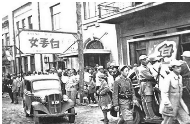
1946年6月，鲁迅艺术学院首次抵达哈尔滨，在大光明电影院演出歌剧《白毛女》。