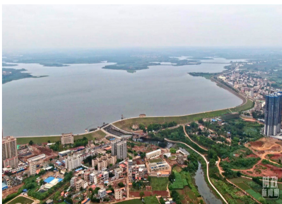
△水库与沿岸城市航拍。