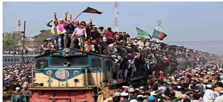
印度记忆：2011年，在孟加拉国首都达卡，数千名穆斯林教徒在参加完世界穆斯林代表大会后，站在火车上或者挂在火车上回家的情景。