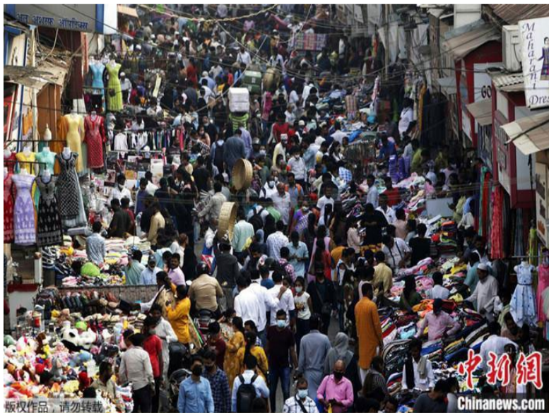
资料图：印度孟买市场中的人群。

中新网4月12日电 综合报道，联合国此前发布预测报告称，2023年印度的人口数量将超过中国，成为全球人口最多的国家。美媒援引人口学家预测称，印度人口数量超过中国的具体时间，大概在4月中旬左右。