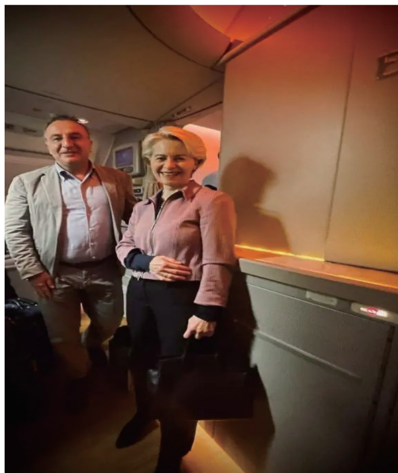
冯德莱恩与法国议员安托万·贾梅机场合影