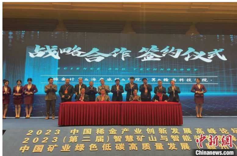
稀土计算、海康威视、华院计算、赣南科技学院战略合作签约仪式。