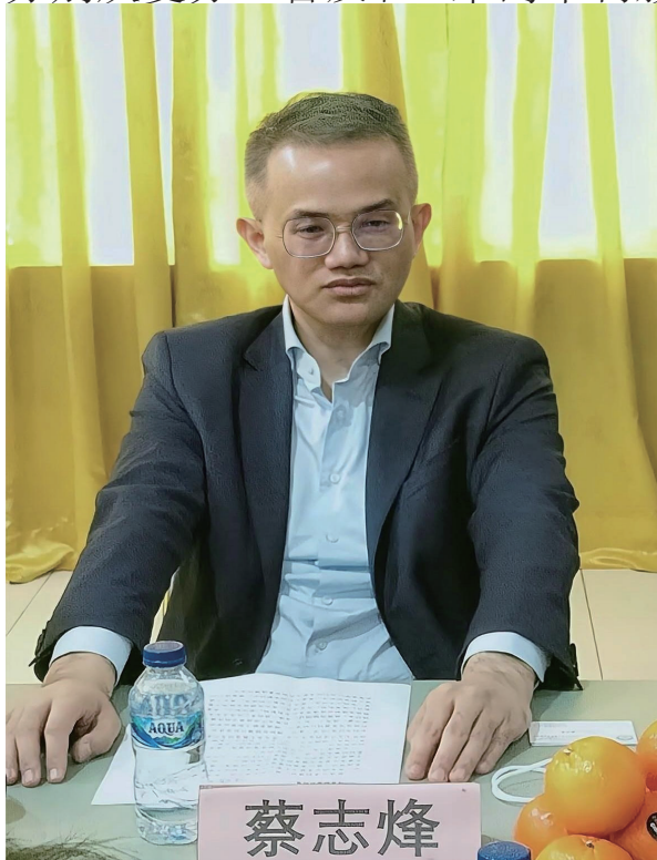
蔡志烽参赞兼总领事致辞