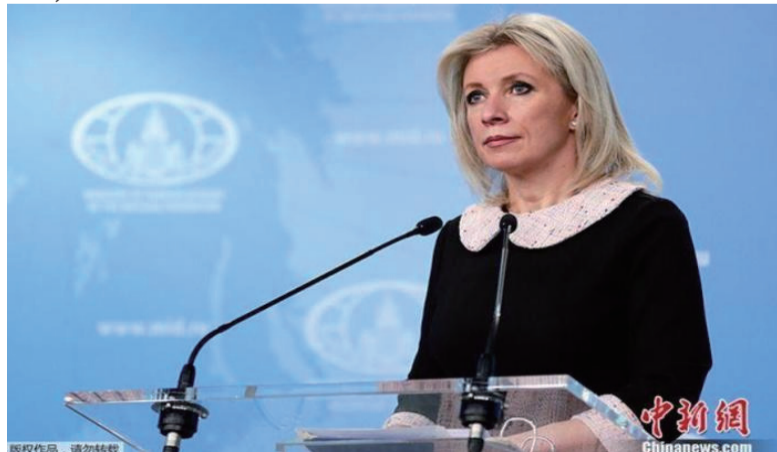
资料图：俄外交部发言人扎哈罗娃。