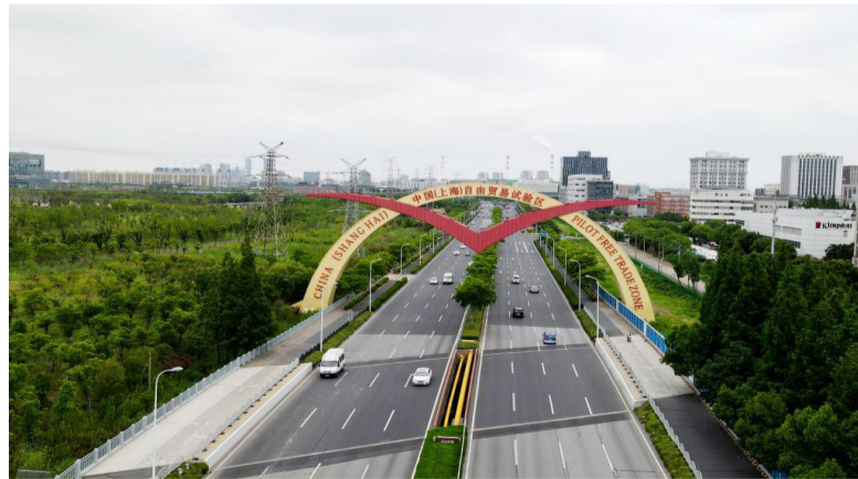
这是位于上海外高桥保税区的中国（上海）自由贸易试验区标志“海鸥门”（2022年6月21日摄，无人机照片）。