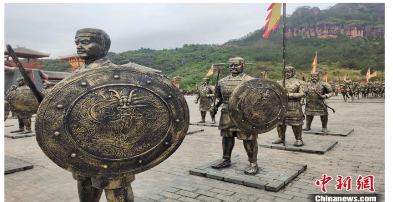
广西铜石岭国际旅游度假区里的雕像群。