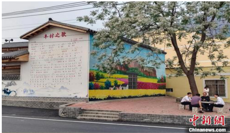
广西北流市民安镇丰村风貌。 黄艳梅 摄