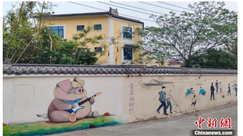
广西北流市民安镇丰村风貌。