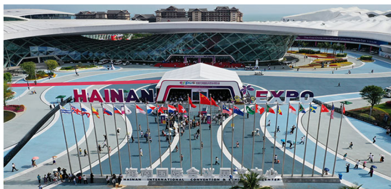
首届中国国际消费品博览会在海南国际会展中心举行