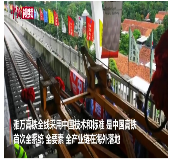
雅万高铁全线采用中国技术和标准,是中国高铁首次全系统、全要素、全产业链在海外落地