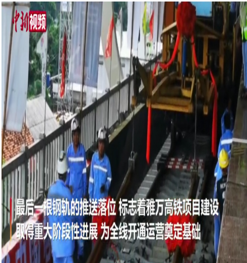
最后一根钢轨的推送落位,标志着雅万高铁项目建设取得重大阶段性进展,为全线开通运营奠定基础