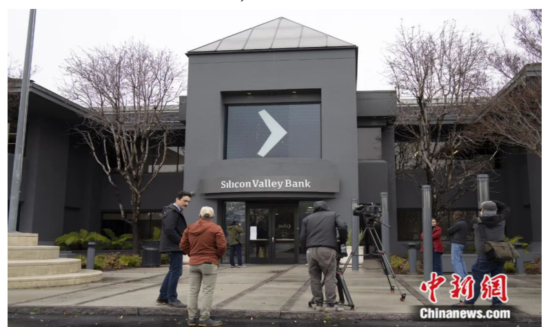
2023年3月10日,记者在美国加州圣克拉拉市硅谷银行总部门前采访。当日,美国联邦存款保险公司(FDIC)表示,硅谷银行因资不抵债已被加利福尼亚州监管部门关闭,由该公司接管。刘关关 摄