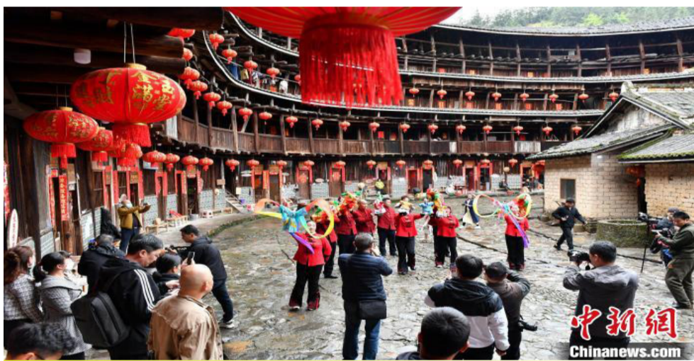
图为海外华文媒体代表们在裕昌楼内参观。