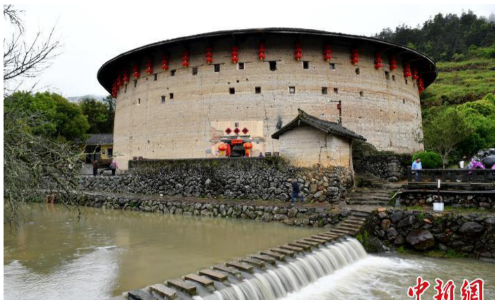
图为裕昌楼。