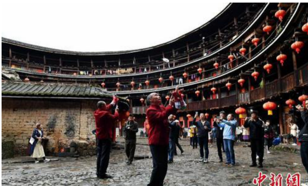
图为裕昌楼里的木偶表演。