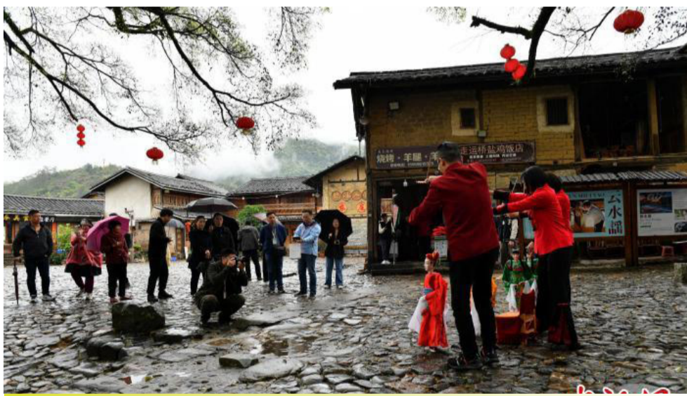
图为云水谣的提线木偶表演。