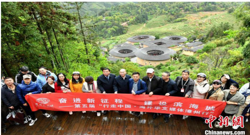
图为海外华文媒体代表在南靖县田螺坑土楼群上观景台合影。