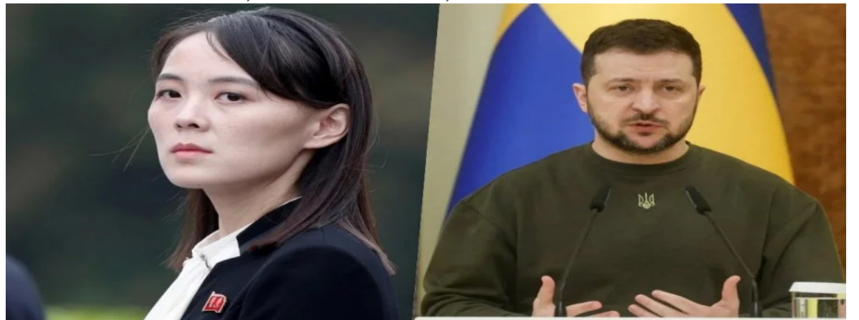
朝鲜领导人金正恩的胞妹金与正周六（1日）批评乌克兰总统泽连斯基策动网络连署