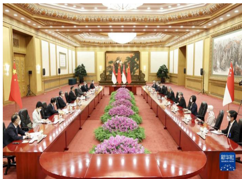
3月31日下午，国家主席习近平在北京人民大会堂会见来华进行正式访问的西班牙首相桑切斯。