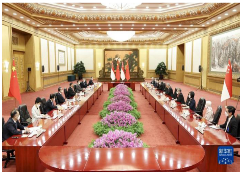
3月31日下午，国家主席习近平在北京人民大会堂会见来华进行正式访问的新加坡总理李显龙。