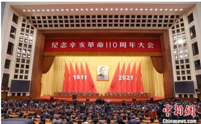
2021年10月9日，纪念辛亥革命110周年大会在北京人民大会堂隆重举行。