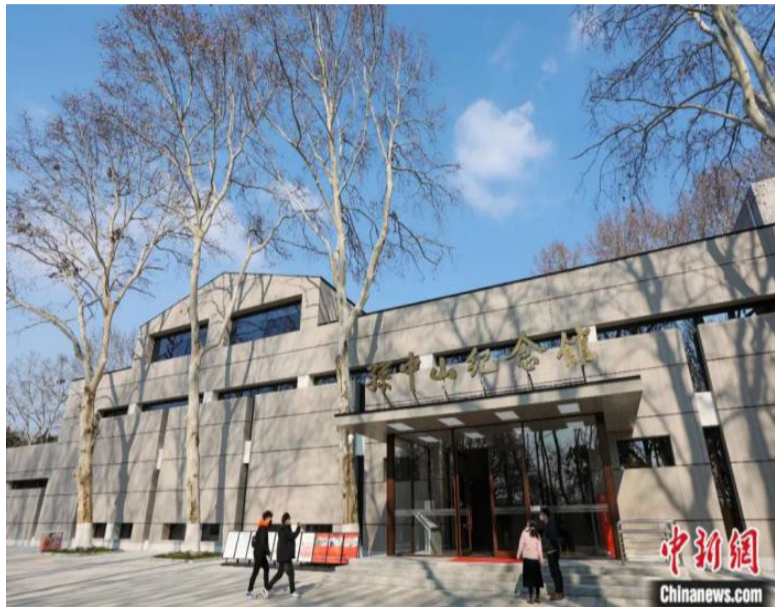
游客走进南京中山陵孙中山纪念馆参观。