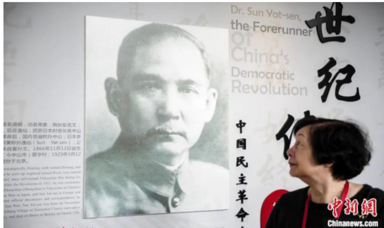
2016年11月16日，由孙中山亲属代表及海外来宾等组成的孙中山先生诞辰150周年纪念活动嘉宾团抵达广州并在中山纪念堂参加纪念活动。