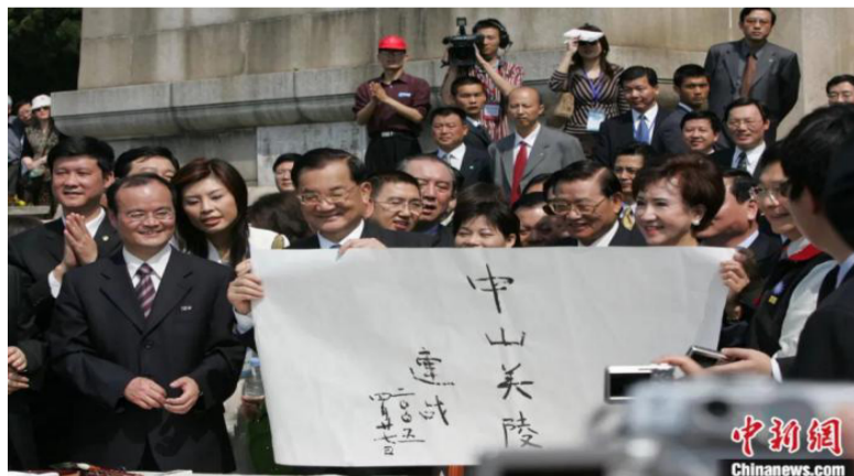
2005年4月27日，连战率领中国国民党大陆访问团赴中山陵拜谒。谒陵后，连战挥毫题字“中山美陵”。毛建军 摄