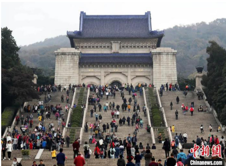
各界人士拜谒南京中山陵。