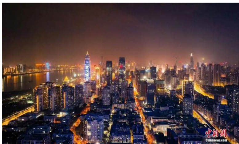
航拍武汉夜景。