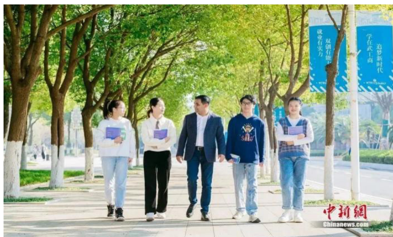
武汉校园大学生。郑子颜 摄