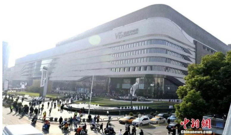
武汉时尚地标。