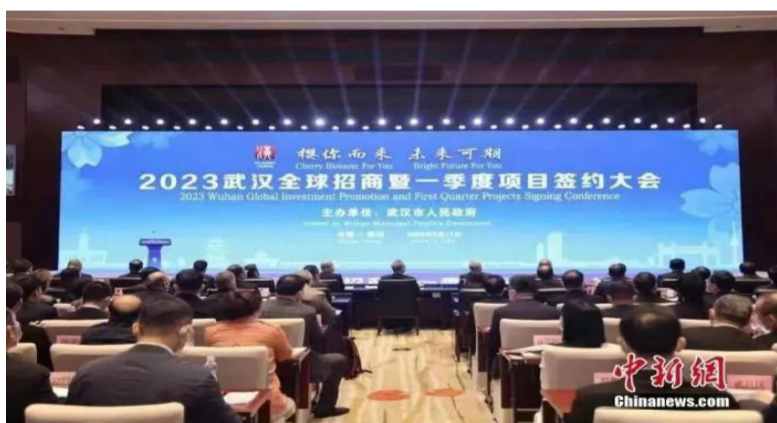
2023武汉全球招商签约大会。