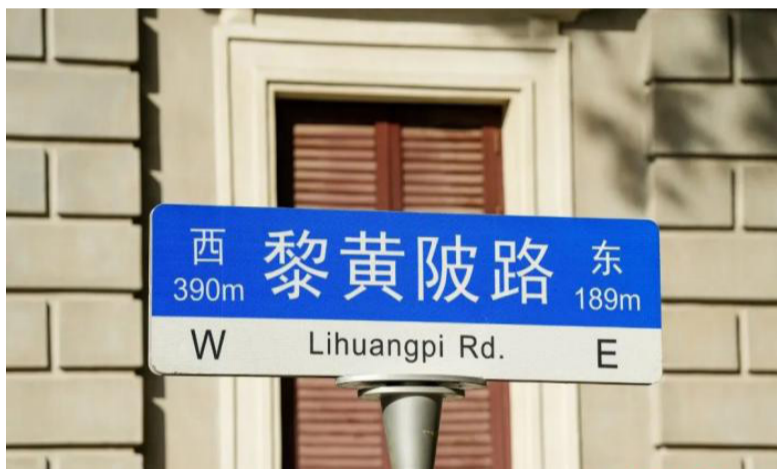
武汉江岸区黎黄陂路。