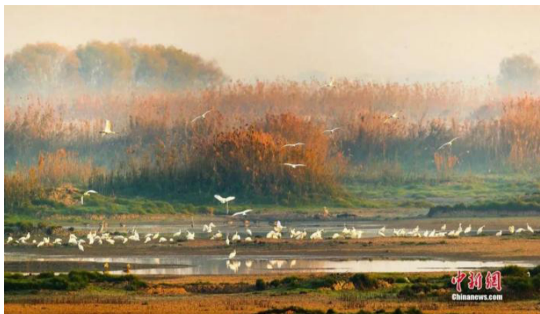
武汉沉湖湿地。