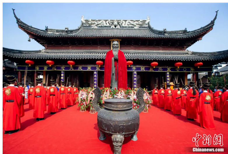
2019年9月28日，孔子诞辰2570周年纪念日，江苏南京夫子庙举行祭孔大典，纪念先贤。

清明将至，祭祖扫墓，慎终追远。3月26日起，中新社“东西问”推出“两岸同祭”特别策划，透过两岸同胞共同祭祀伏羲、黄帝、炎帝、孔子、屈原、妈祖、中山陵的文化遗产，洞见两岸同一血脉，同根同源、同文同种、两岸同祭。敬请垂注。