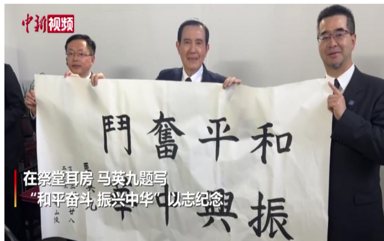
在祭堂耳房 马英九题写“和平奋斗 振兴中华”以志纪念

南京中山陵是为了纪念一代伟人孙中山而建造的，整个陵墓的都用的是青色的琉璃瓦、花岗石墙面，显得庄重肃穆，青色象征青天——青天白日满地红的意思。青天也象征中华民族光明磊落、崇高伟大的人格和志气。青色琉璃瓦乃含天下为公之意，以此来显示孙中山为国为民的博大胸怀。