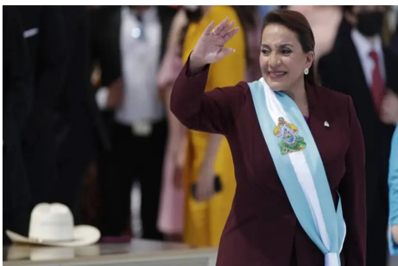
主张和中国建交的洪都拉斯女总统 卡斯特罗（Xiomara Castro）

2023年温暖的春天降临大地的时候，从北京传来一项好消息，中美洲国家“洪都拉斯”共和国