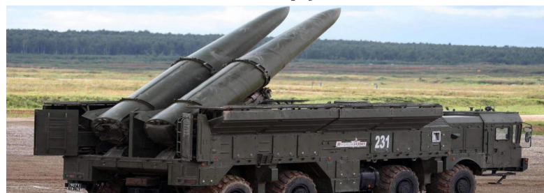
白俄罗斯国防部称，白俄罗斯武装部队已开始全面独立操作“伊斯坎德尔”导弹系统