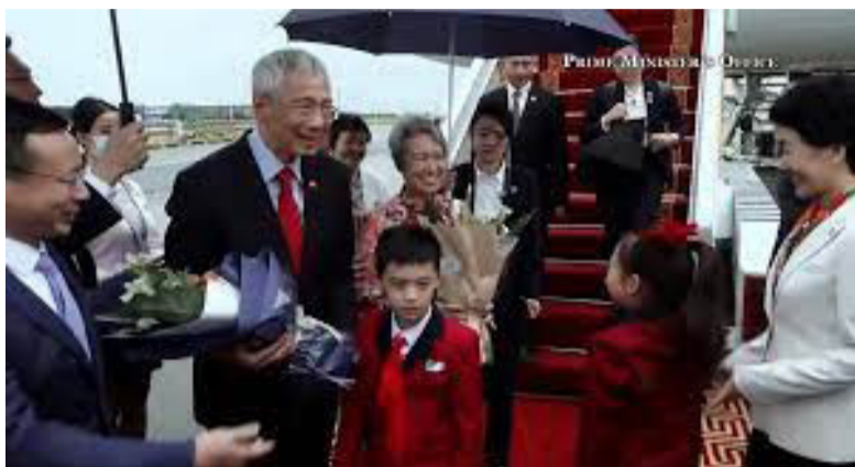
新加坡总理李显龙偕夫人抵华，开启六日中国行

3月27日，新加坡总理李显龙偕夫人抵达广州，开始对中国进行为期六天的国事访问。新加坡总理公署发布公告称，期间李显龙将到访北京、广东广州和海南博鳌。