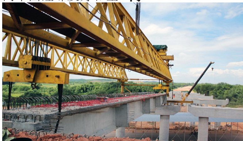
资料图：南宁—凭祥（友谊关）—凉山—河内高速公路建设现场