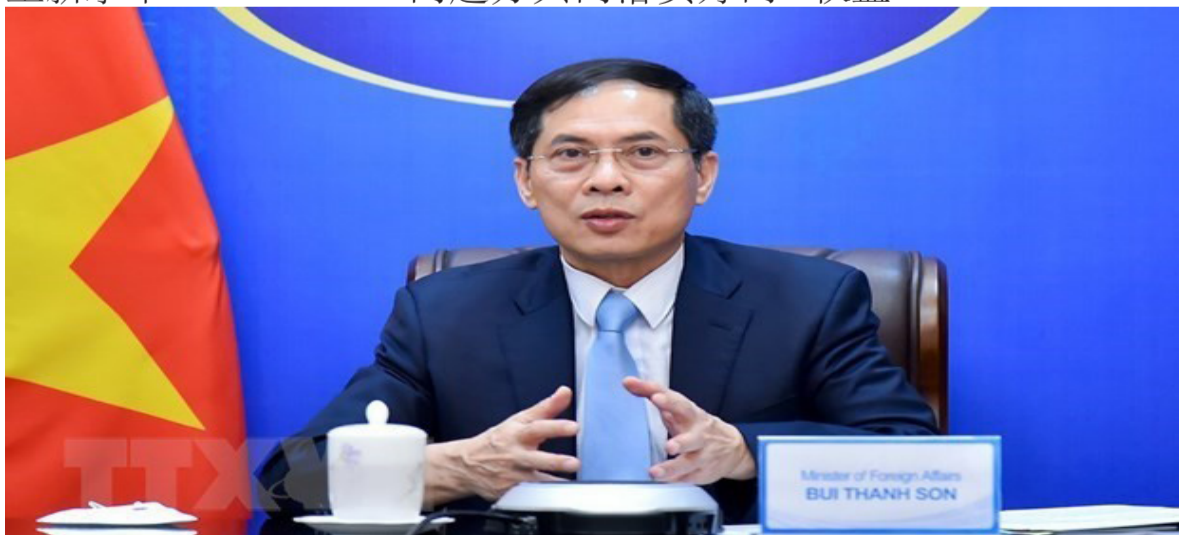
资料图：越南外长裴青山