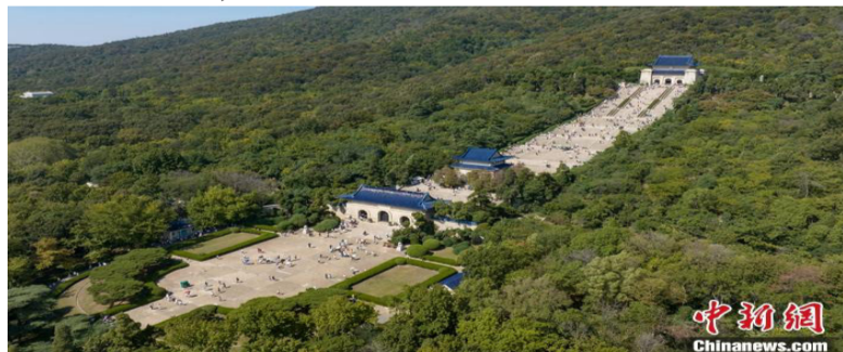
图为航拍南京中山陵。(资料图、无人机照片)