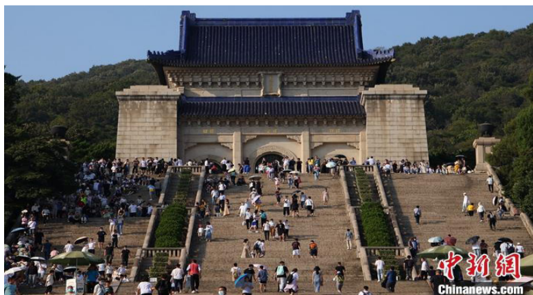
图为民众在南京中山陵参观。(资料照片) 中新社记者 泱波 摄