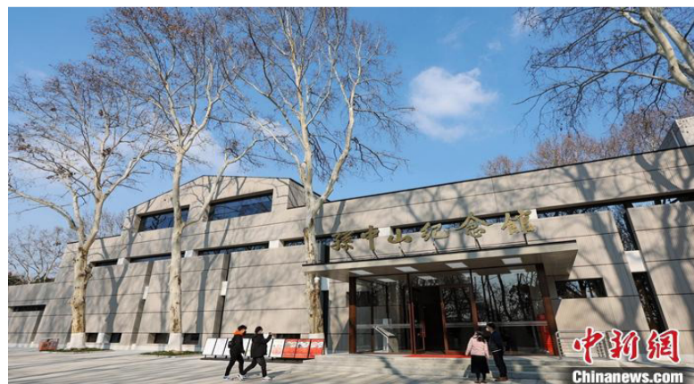
图为南京孙中山纪念馆。(资料照片)