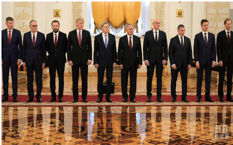
△参加欢迎仪式的俄方代表。