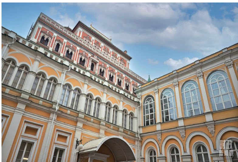
△当地时间3月21日，莫斯科，克里姆林宫。