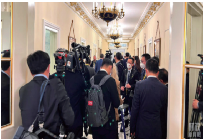
△等待进入会场的新闻记者挤满走廊。