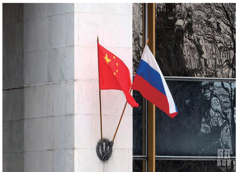
△俄罗斯联邦政府大厦门口两侧悬挂中俄两国国旗。