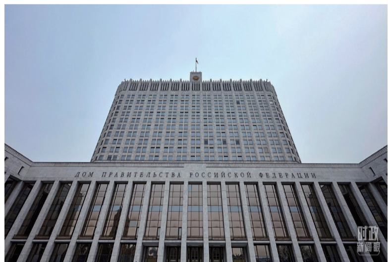
△俄罗斯联邦政府大厦。