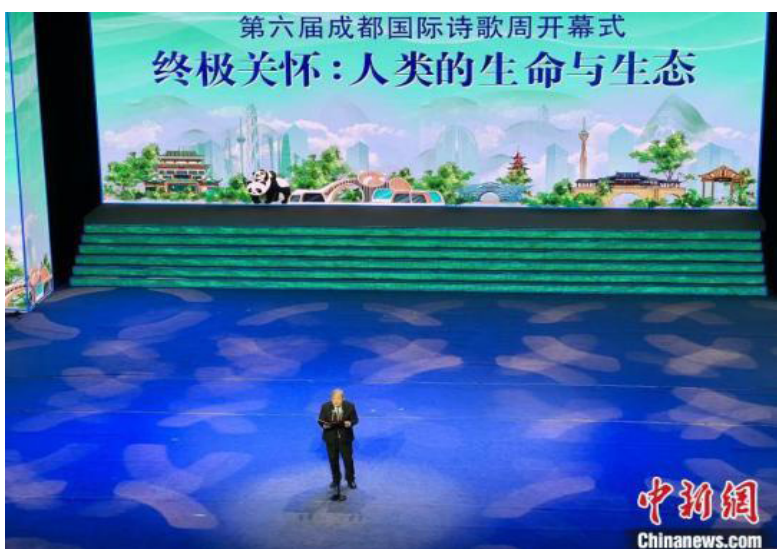
开幕式现场。岳依桐 摄